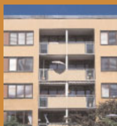
Alnmättet 1 , Tideliussgatan 11–43 på Södermalm byggt 1968. Brydes arkitektur under 1960- och 70-talen är ofta putsad i jordfärger som ger husen extra tyngd och massa. Volymerna är kraftiga med skarpskurna hörn. Foto Göran Fredriksson, 2001.