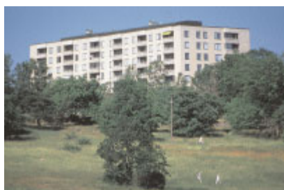
Kampementsbacken 3 , Kampementsgatan 32–38. Foto Göran Fredriksson 2001.