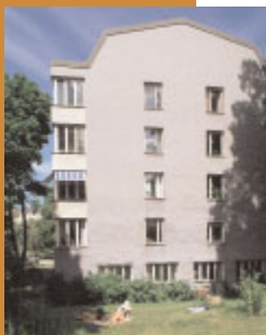
Riset 6 , Tengdahlsgratan 20–22 på Södermalm. Lars Brydes allra minsta projekt. Detta femvånings punkthus från 1971, putsat i blått, har i pressen kallats för Stockholms första postmodernistiska hus. 2001.