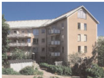
Blocket 31 , Matrosbacken 8–12, Utviksbacken 19. I Gröndal har Backström & Reinius stjärnhus påverkat Lars Bryde i utformningen av kompletterande nya och större stjärnhus i rosa puts (1982–85). 2001.